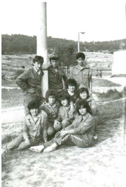
Подкова – 1987год.