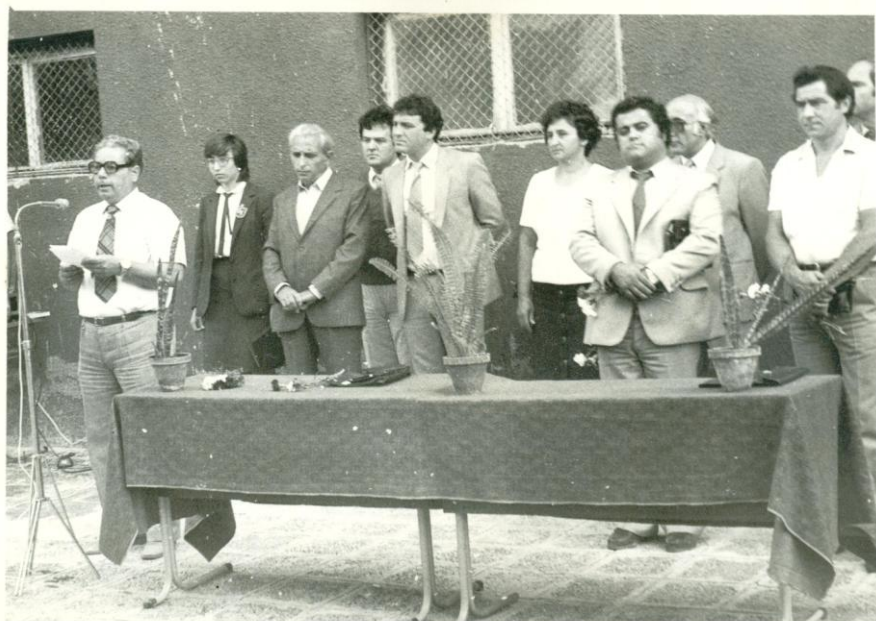
Директор, заместник-директори и гости на тържество