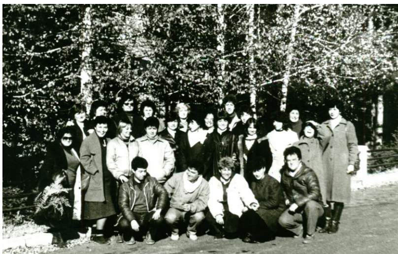
На Белите брези 1988 година