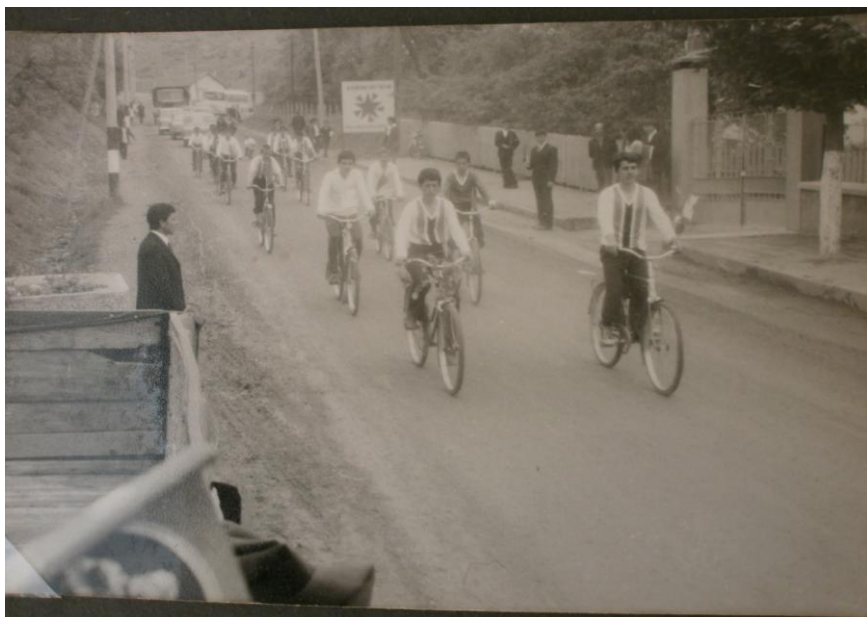
Шествие на велосипедисти