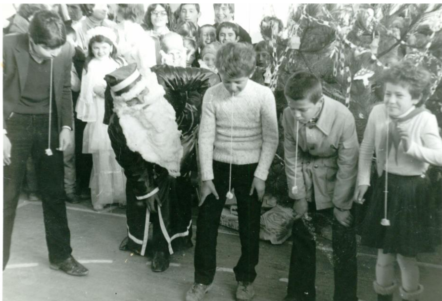
Дядо Мраз наблюдава състезание с локум.

журналистите, на която се разискват различни въпроси, свързани с учебно-възпитателната работа, с внедряването на новото учебно съдържание във втори и десети клас, с преустройството на образованието.