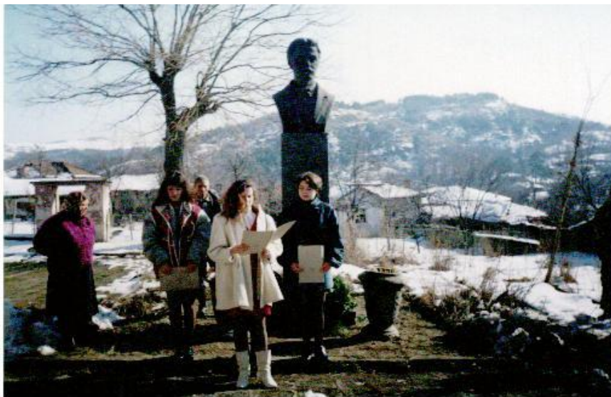
19 февруари 1996 година – паметникът на Васил Левски в с. Пчеларово