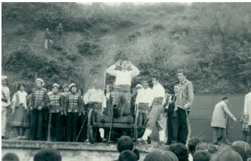
Пресъздаване на събития от април 1976 година.