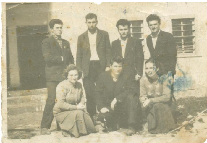
1947 год. Едни от първите учители в училището

През 1948 година е приет Закон за Народната просвета, който променя образованието в България. Частните училища са ликвидирани. Въведено е задължително образование до 16 годишна възраст. Въведен е 11-годишен курс на обучение в средните училища, образованието е професионализирано /в съответствие с нуждите на живота/.