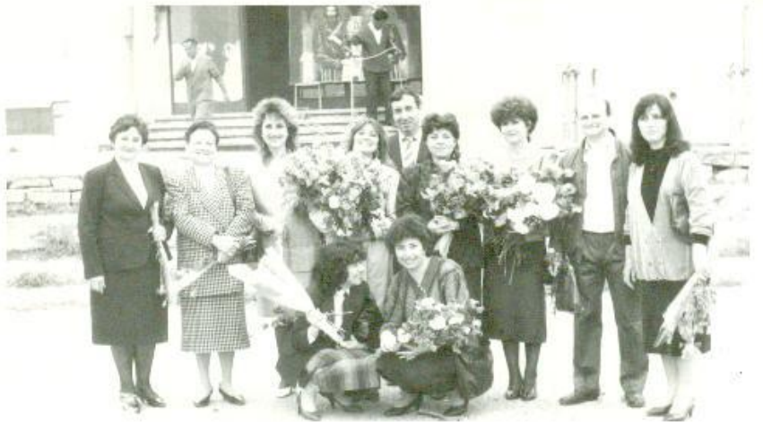
24 май 1991 година

Следващата учебна година – 1991/92 започва при извънредна ситуация. Започва безпрецедентен в историята на българското образование протест. Протест, оглавен от партия ДПС, за въвеждане на майчин език като редовен учебен предмет с изучаване 4 часа седмично, съизмеримо с изучаването на българския език. Училището опустява, класните стаи остават празни за повече от два месеца. Сред стачкуващите има и деца на наши колеги. Показателен е факта, че добрият тон между колегите не се нарушава. След определен момент обаче започва притеснението от възможността за анулиране на учебната година за протестиращите ученици. За нас това означава 100%. От 18 ноември учениците започват да се завръщат в класните стаи, а от 25 ноември всички ученици са вече на училище. С постановление № 232 от 29 ноември 1991 г. се узаконява изучаването на майчин език в общинските училища. Изучаването става под формата на СИП (свободно избираема дисциплина) в рамките на 4 часа седмично от втория срок на учебната 1991/92 г. Изучаването се предвижда от III до VIII клас. По-късно през годините това постановление се изменя.