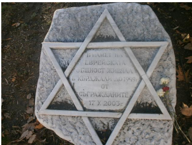
Плочата в градската градина

Посвецам на 70-годишнината от спасяването на българските евреи.