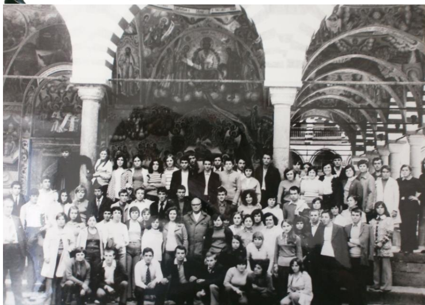
В Рилския манастир