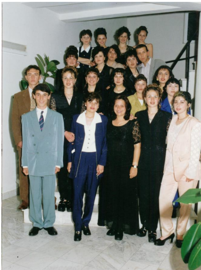
Випуск 2000 с класната ръководителка – ресторант „Арда строй” – гр. Кърджали