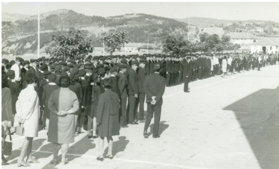
Строени пред училището.