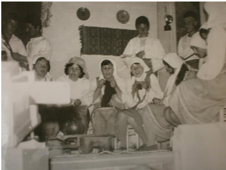
Битовата група пресъздава седянка.

През 1976 година се навършват 100 години от Априлското въстание. Провеждат се различни мероприятия с учениците. Събитието е отбелязано с голямо тържество в читалището в Черноочене. Провежда се рецитал-конкурс „На Априлци бунтовни и Бузлуджа горда – достойни чеда”. Ученици пресъздават моменти от Април 1876г. Облечени във въстанически дрехи – Боримечката, Райна княгиня, Георги Бенковски и други. На знамето пише „Свобода или смърт”. Преживяванията са неуписуеми.