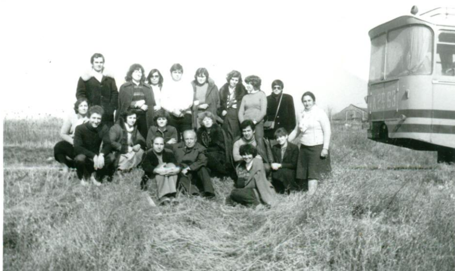
На екскурзия. До автобуса.