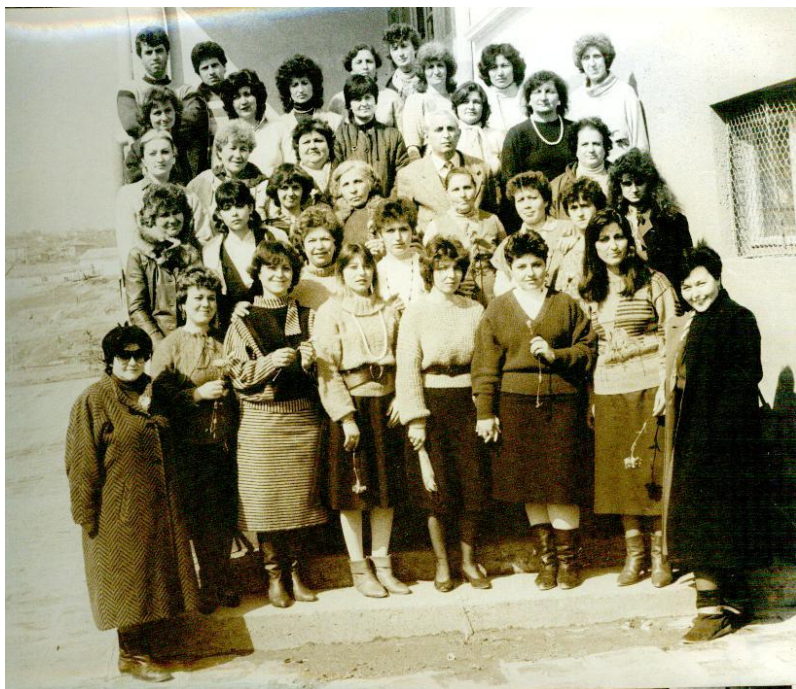
Колективът 1988/1989 учебна