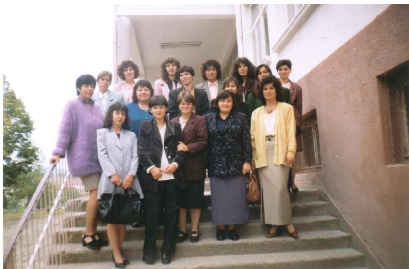
На прага на новото хилядолетие