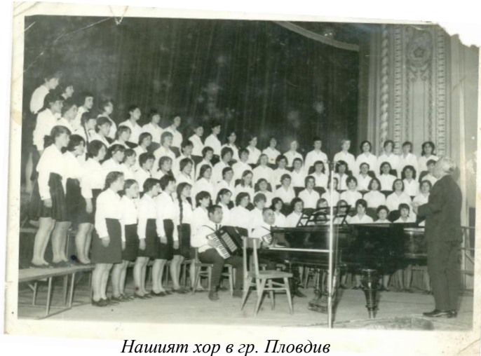
Нашият хор в гр. Пловдив