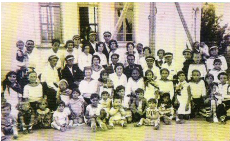
Еврейски деца и ученици честват празника „Йом Ашекел“

Еврейските деца са сред първите ученици в първото училище в града „Отец Паисий“. То е открито през есента на 1913 година с 8 ученици. Още в началото на 1914 година се записват 10 еврейски деца и още 8 български. Това е показател за вроденото ученолюбие в еврейските семейства, които много скоро след идването си активно „влизат“ в обществения живот на града. Поради малкия си брой еврейските деца продължават и по-късно да се обучават в общоградското училище „Отец Паисий“. В продължение на една година функционира еврейска забавачница, за която са отпуснати пари от градските фондове. Друг пример за активното участие на евреите в културния живот на Кърджали са дружествата „Макаби“ и женската организация „Вицу“. Членовете им стават инициатори за образователни, културни и религиозни прояви - тържества, карнавали и балове. Създава се детски хор и театрален състав „Макаби“.