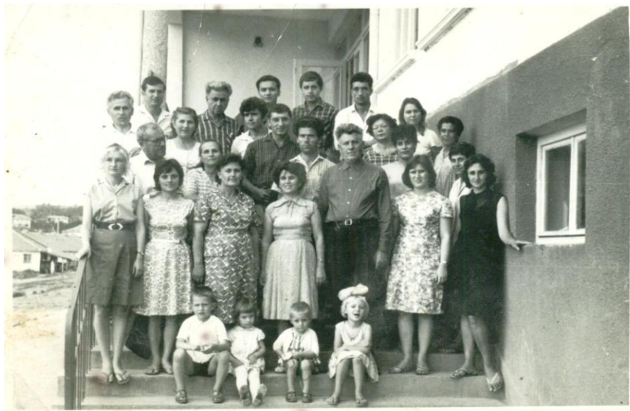
Учителският колектив – 70-те години