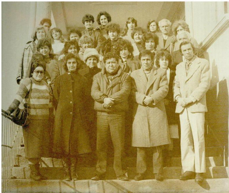
Колективът 1989/1990 учебна година