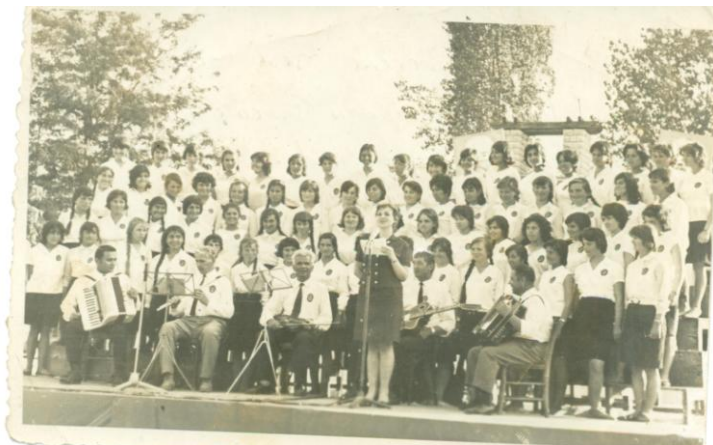
Средношколският хор при СПУ „Христо Смирненски”