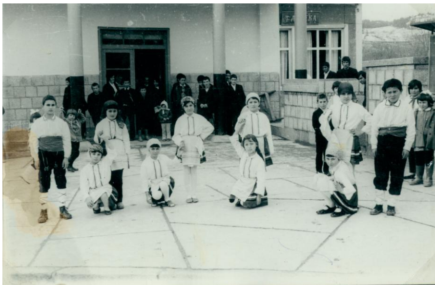
Част от тържествата 1976 година