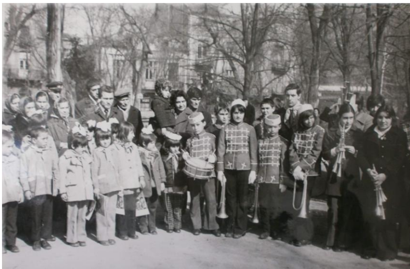
Приемане на третокласници за пионери в гр. Пловдив