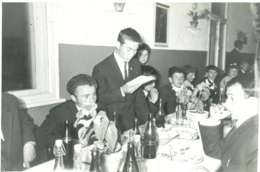
Първият абитуриентски бал – май 1966 година

На зрелостния изпит /това е първият випуск на средното училище в Черноочене/ от 71 абитуриенти на изпит са допуснати 70, един повтаря. От тях направо на матури се явяват 42, останалите 28 са с поправителни изпити.