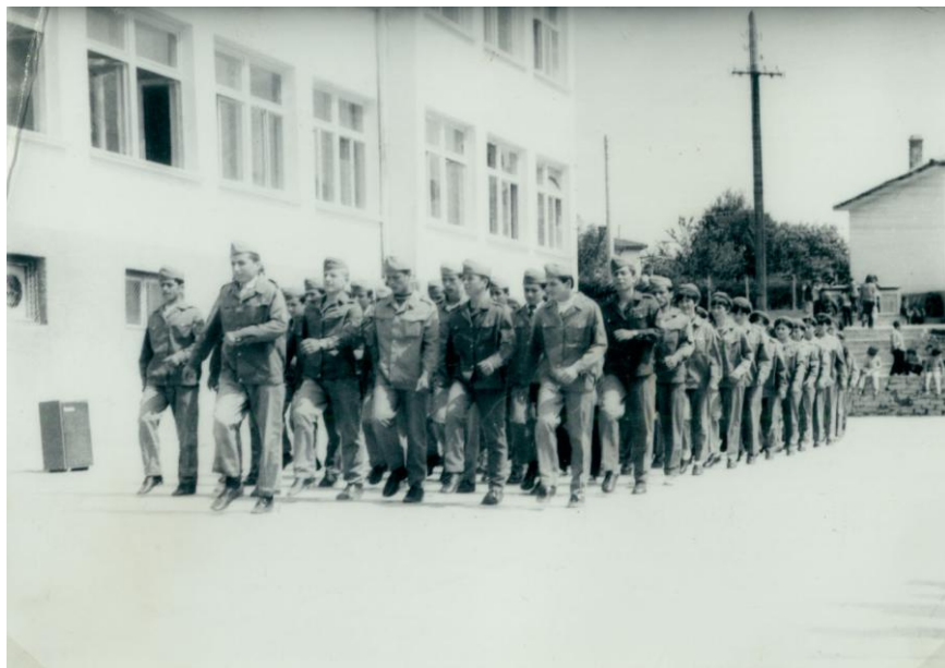
Заминаване за военно обучение.

учениците от X клас е запазена и до днес, но с различно предназначение – през есента на 2012 година по повод 100 години от Балканската война в базата нощуват участниците в похода „По стъпките на ген. Делов”, тази година също ще нощуваме там.) По-късно военен лагер се организира и в с. Подкова, където също ходят наши ученици – през учебната 1986/87 г.