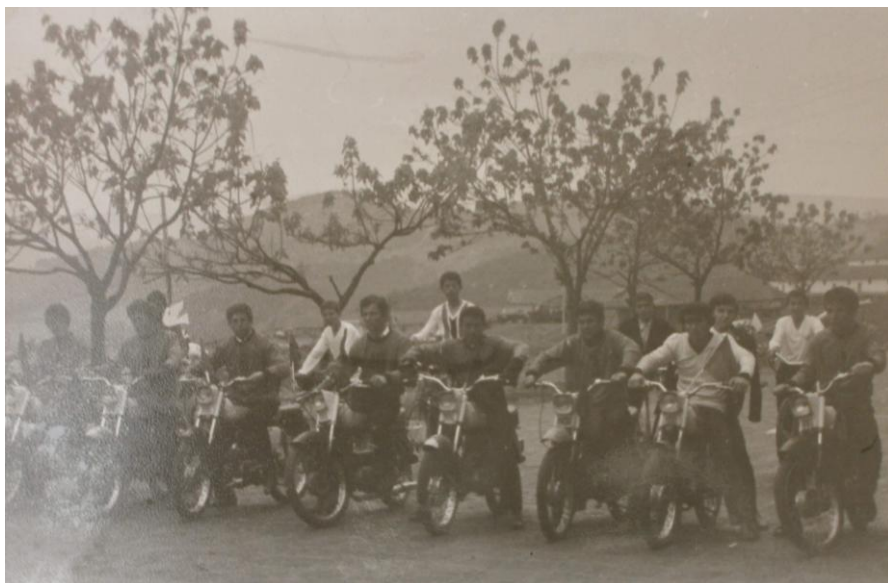
Състезание с мотореди

Във връзка с патронния празник – 29 септември се организира поход до паметника на загиналите в Балканската война в с. Пчеларово. Представителна група от чавдарчета, пионери и комсомолци полагат венци. В началото на м. октомври учениците и учителите участват и в организирания от ОК на МКП митинг-заря в с. Пчеларово по случай 70 години от Балканската война.