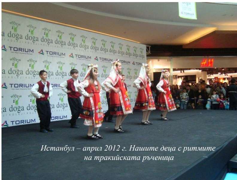
Истанбул – април 2012 г. Нашите деца с ритмите на тракийската ръченица

Последната вечер ни организираха парти, на което децата се забавляваха с новите си приятели и си обещаваха отново да се срещнат. Освен песни, танци и широки усмивки учениците ни им подариха и сувенири от България. Направихме много снимки, скътахме незабравими спомени. Прибрахме се живи и здрави в нашата родина, всеки докоснал се до друга култура, бит, атмосфера на приятелство и толерантност. Почерпил опит и много идеи.”