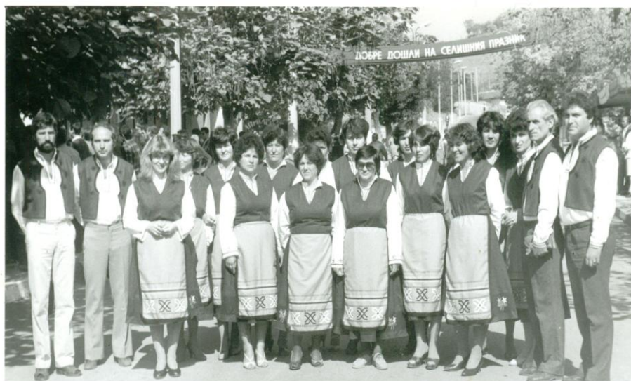
Учителският хор на селищния празник в с. Черноочене