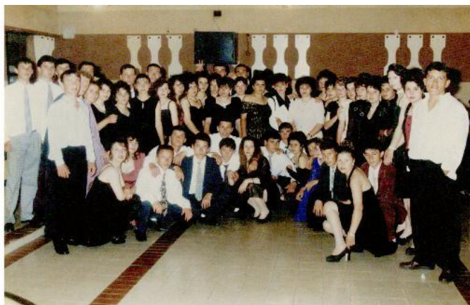
Випуск 1996 – ресторант „Роза”, Черноочене

До випуск 1996 традиционно абитуриентските балове се провеждат в ресторант “Роза” (дн. „Авалон”) в с. Черноочене. Въпреки желанието на абитуриентите и част от техните класни балът им да бъде под формата на екскурзия до Охридското езеро, република Македония, идеята така и не се осъществява и те също остават да празнуват в с. Черноочене. Следващите два випуска – 1997 и 1998 празнуват в град Кърджали – ресторант „Арда строй”.