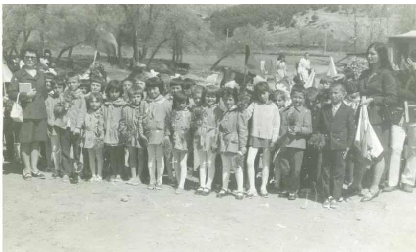
Деца от началния курс с учителките си.