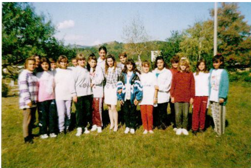
Септември 1996 год. – 9в клас с класната ръководителка, класът, който през 1998 год. бе разформиран