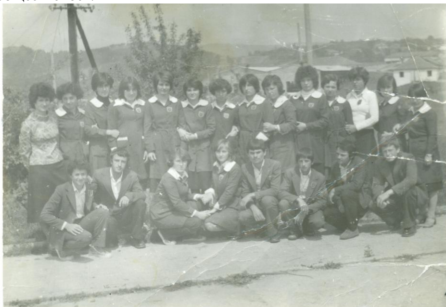
С униформа и класната ръководителка

униформата е въведена през 1980/81 учебна година. Отбелязано е, че новата униформа прави добро впечатление на цялата общественост.