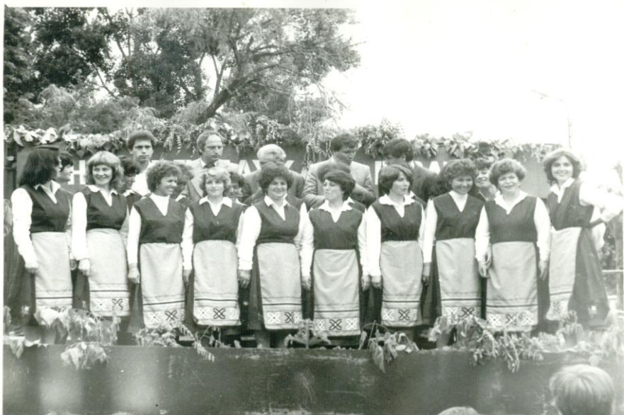
Учителският хор 1987 година