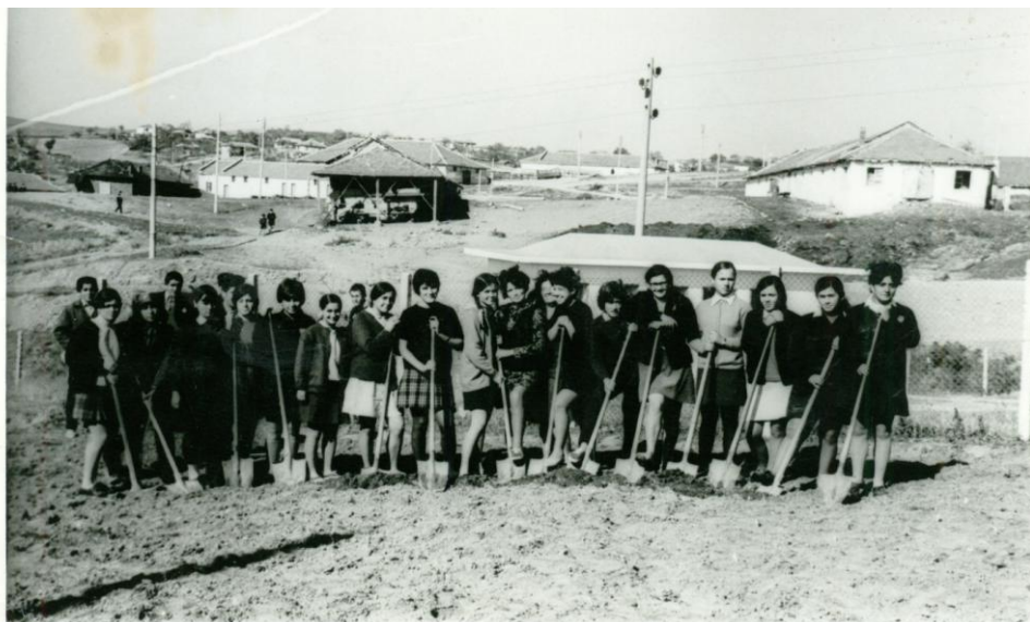
Ученици помагат при строежа на оградата.