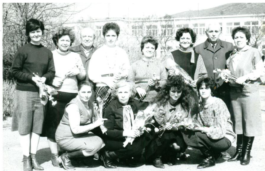
24 май 1989 година