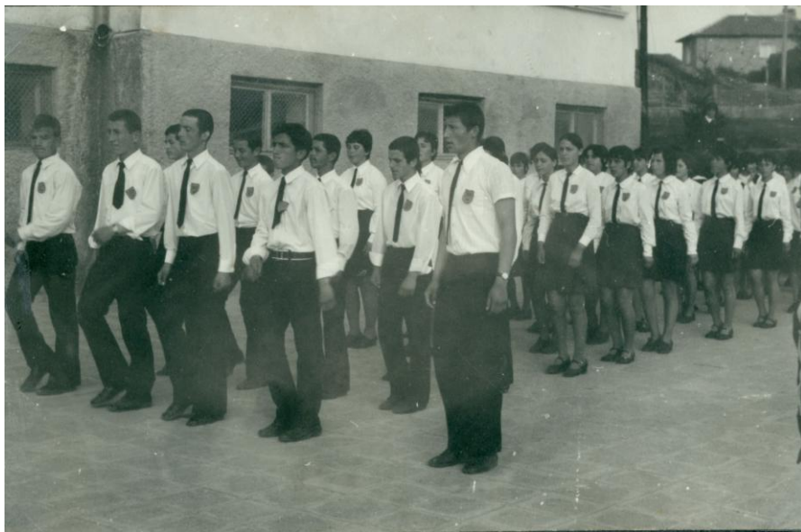
Строева подготовка на комсомолци

Участниците в шестия републикански пионерски сбор обявяват: Рапорт-проверка „С комунистите и комсомолците в единен строй“. Проверката е на два етапа: първият – „Здравствуйте братушки“, посветен на 60 години от ВОСР и 100 години от Освобождението на България от Османска власт.