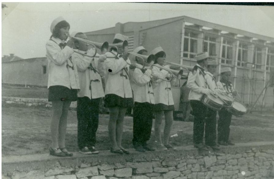
Фанфарната музика при училището

- Добре работи и пионерският хор съвместно с малкия състав духова музика, фанфарен и барабанен състав, които се изявиха на наши тържества. Недостатъчна бе помощта от страна на класните ръководители.