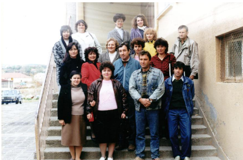
Част от колектива 1994 година