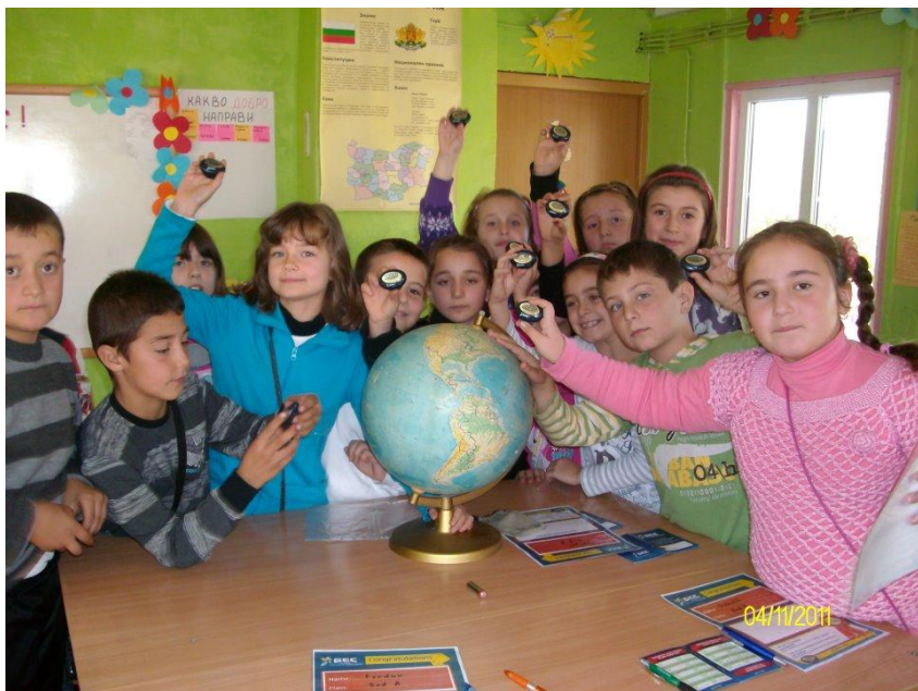
С крачкомерите в ръка

От месец декември 2011 година работим по проект „Подобряване на качеството на образованието в средищните училища, чрез въвеждане на целодневна организация на учебния процес”. Продължителността на проекта е 36 месеца – до месец ноември 2014 година. Проектът е съфинансиран от ЕСФ по Оперативна програма „Развитие на човешките ресурси” 2007 – 2013 г. Учениците включени в проекта са от I и II клас и съответно техните възпитатели също работят по проекта.