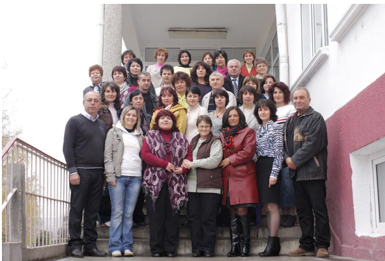
Ние – октомври 2012 година