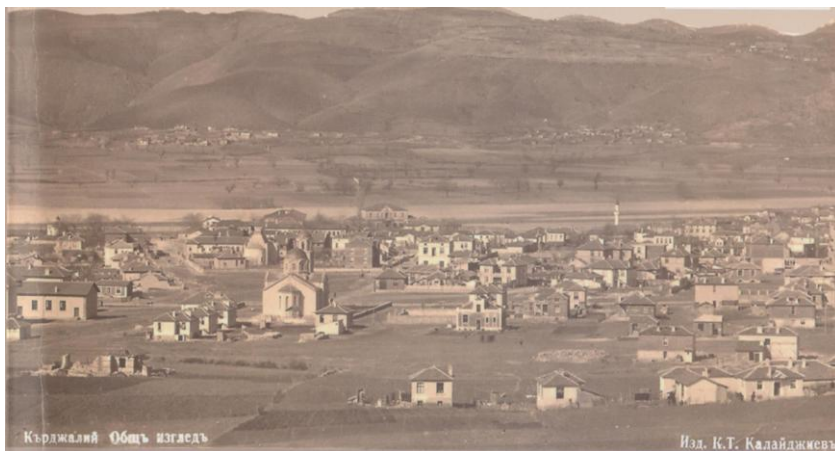
Общ изглед на Кърджали 1935 година /на преден план се виждат християнската църква и еврейската синагога, а в далечината до реката – мюсюлманската джамия/