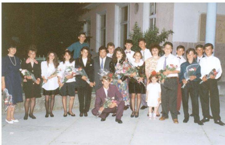
Випуск 8 клас

До випуск 1996 традиционно абитуриентските балове се провеждат в ресторант “Роза” (дн. „Авалон”) в с. Черноочене. Въпреки желанието на абитуриентите и част от техните класни балът им да бъде под формата на екскурзия до Охридското езеро, република Македония, идеята така и не се осъществява и те също остават да празнуват в с. Черноочене. Следващите два випуска – 1997 и 1998 празнуват в град Кърджали – ресторант „Арда строй”.