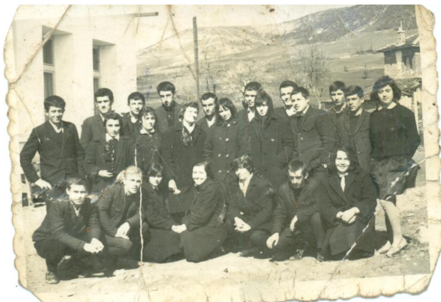
Ученици пред старото училище, след откриване на новата сграда, служещо за общезитие.

Истинският си облик училището придобива след построяването на новата сграда, която ползваме и до днес, и преместването на обучението в нея. Това става през учебната 1962/63 година. Директор е Петър Жеков Несторов.