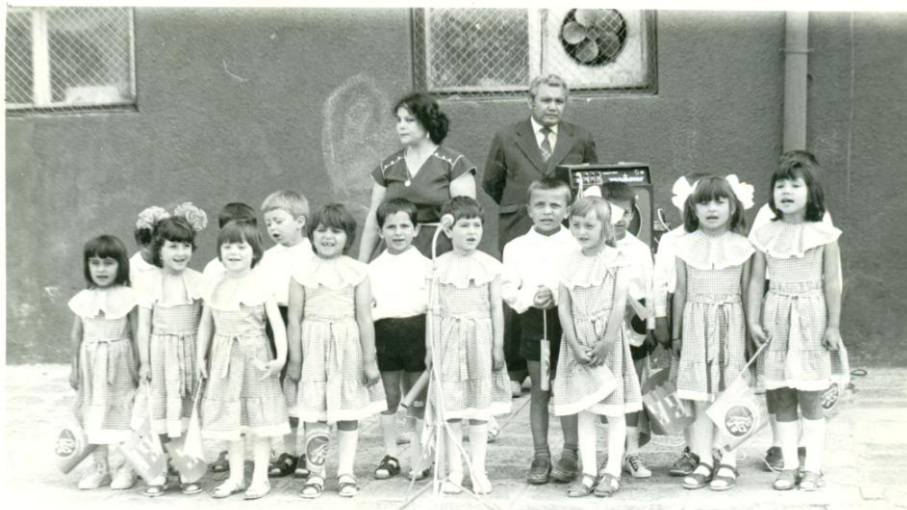
Децата от детската градина изнасят програмата.