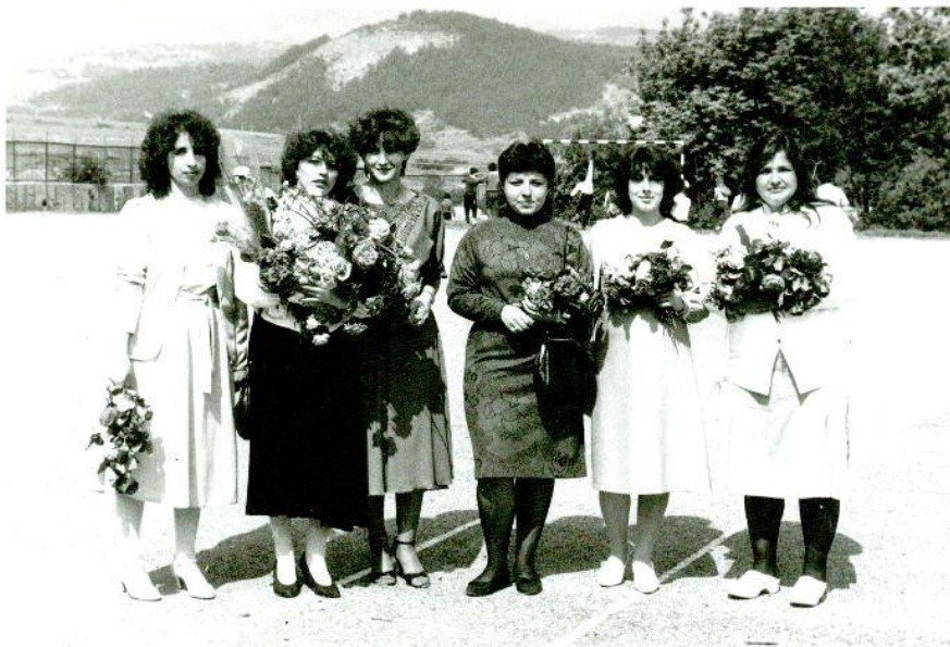
24 май 1990 година

състезания с радост се включват всички ученици, а също и учителите. С много смях и веселие се излъчват победителите, които получават награди.