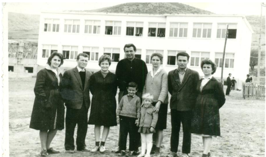
Учители пред новопостроената училищна сграда.

Първо са построени по три учебни стаи на два етажа, с малки помещения за учителски стаи, а след това се дострояват още по три учебни стаи на етаж, плюс още едни вътрешни стълби, фоеа на първия и втория етаж и помещения на втория етаж, предвидени за учителска стая и дирекции. На първия етаж се достроява още една учебна стая и допълнителни помещения, в които днес се помещават медицинския кабинет, тоалетните и архива на училището.