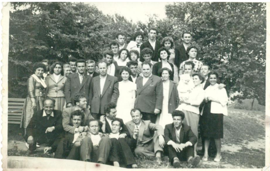
Учителски колектив – 60-те год