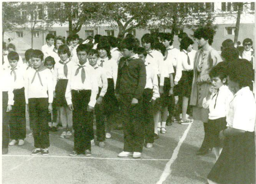
Отрядът на VIв клас с класната ръководителка

На 10 ноември 1989 г. пада комунистическия режим. Тодор Живков – ръководителят на БКП и държавата е свален от власт. Дълго таената народна енергия се отприщва и започва буря от събития – митинги, протести, шествия.