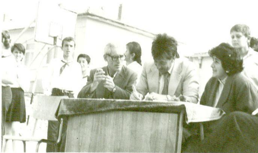
Журиго на последния спортен празник преди 10 ноември 1989 година.