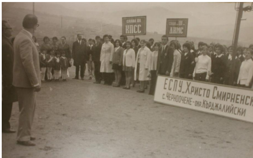
Отрядът на ЕСПУ „Христо Смирненски“