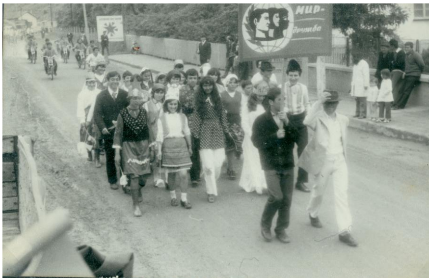
Шествие на „народите” пред общината в с. Черноочене