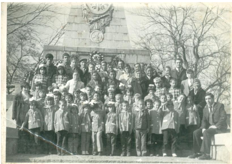
Гр. Пловдив – снимка за спомен пред паметника на руските освободители