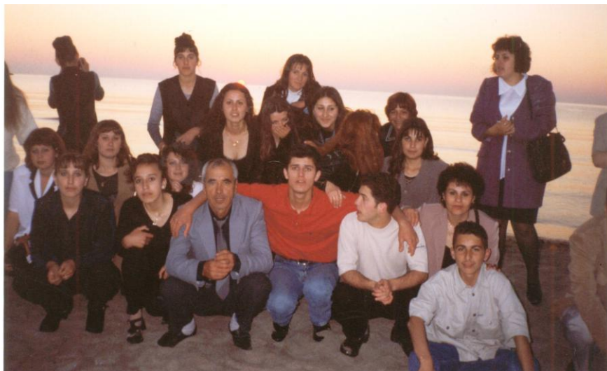
Първият випуск на бал в гр. Созопол – май 1999 година.