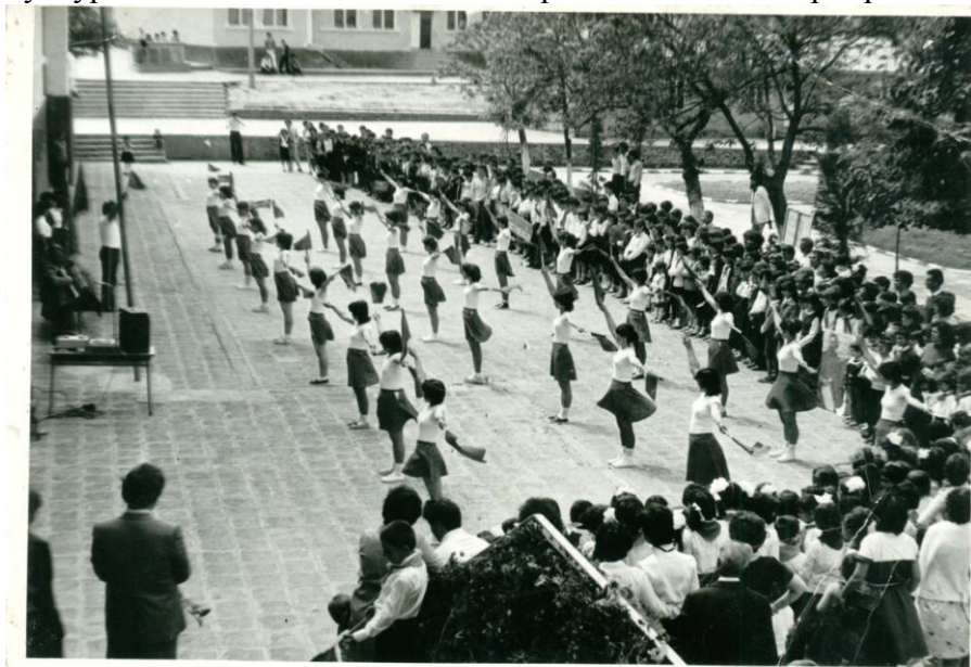
Първата музикална композиция, изнесена в нашето училище.

И още: приемането на първокласниците в четата „Чавдарче”, денят на младия антифашист, прегледът на забавната песен, рецитали-конкурси, вътрешен преглед на художествената самодейност и др. Много добри изяви има групата за политически песни с ръководители студенти от Ід курс на Учителския институт в гр. Кърджали, с които нашият колектив сключва договор и поема шевство. Трите колектива – учителският, студентският и ученическият провеждат интересни културни и спортни мероприятия.