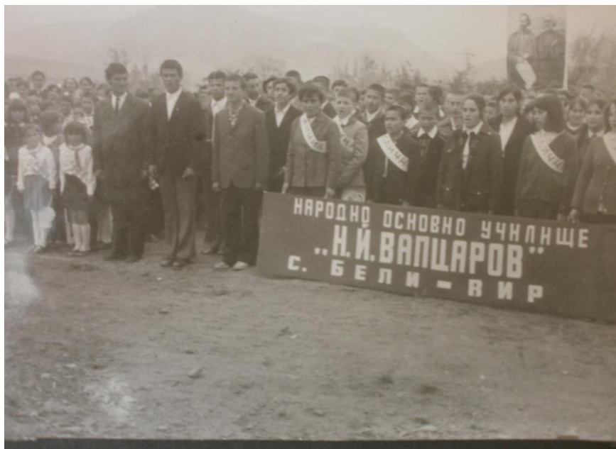
Отрядът на закритото вече училище в с. Бели вир