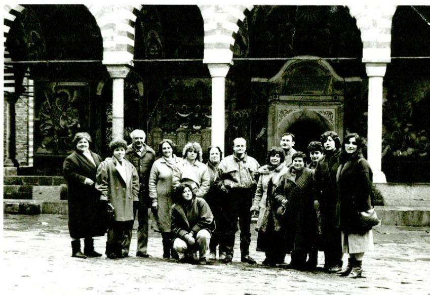
Част от колектива в Рилския манастир – 1990 година.

През учебната година наименованието на училището се променя от ЕСПУ - в СОУ (Средно общообразователно училище). Поради спиране на постановление №7 за по-високи заплати на педагогическите специалисти в слабо развити райони, а също и на постановление № 800 за разпределение на млади специалисти в изостанали райони на страната (всичко това „благодарение” на прехода, за първа година от съществуването на нашето училище като средно, почти всички учители са от община Черноочене и град Кърджали, което вече е предпоставка за по-малко текучество.