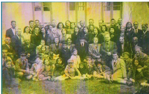
Част от еврейската общност в Кърджали

Кметството предоставя на еврейската община и отделен сектор в старото градско гробище на едно възвишение над днешния стадион в парка „Простор“. Погребалният обичай се извършва според еврейската традиция, а гробовете се запечатват с тежки каменни плочи. Гробището се ползва до 1949 година и е закрито през седемдесетте години на XX век. Наличието на еврейски квартал, църква и гробище свидетелстват, че през тридесетте години на XX век, в Кърджали е съществувало еврейско общество. По силата на своята относителна малобройност в сравнение с останалите етнически групи - българи, турци, арменци, то е трябвало не само да съхрани етническата си специфика, но и да намери своето място в обществото.