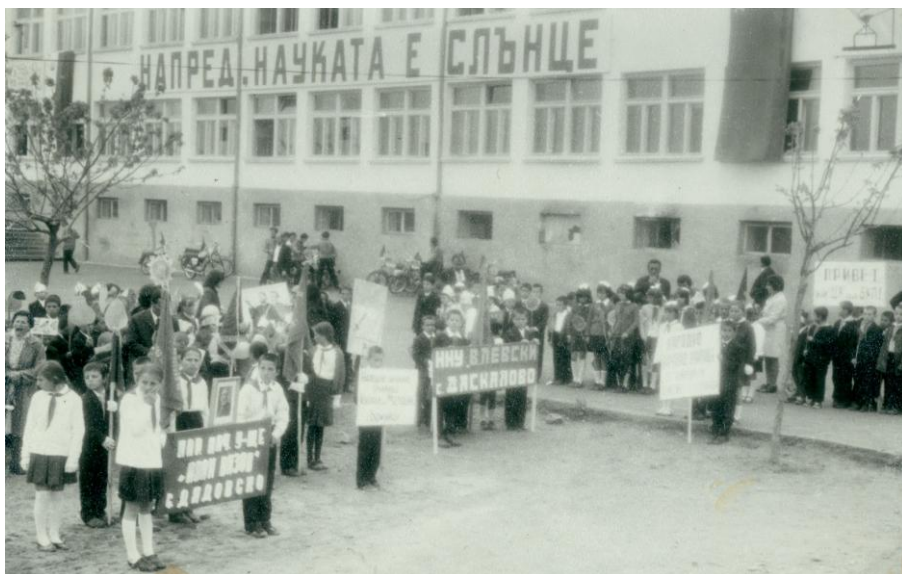
Част от отрядите на училищата в общината на тържествената манифестация.

писменост и българската просвета се провежда за пръв път по особен начин. Всички ученици от всички училища в общината с плакати, знамена са строени в училищния двор. Провежда се манифестация, изразяваща три етапа: минало, настояще и бъдеще с подходящо озвучаване. Следва тържество в училищния двор за сдаване на знамената и за сбогуване на зрелостниците със знамето на училището и с учителите. След това се провеждат физкултурни състезания.