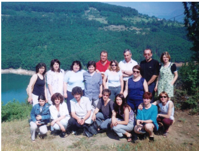
На брега на язовир Кърджали