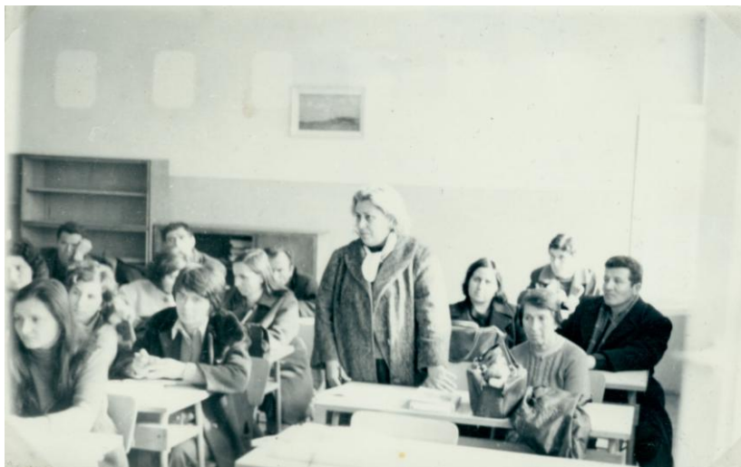
Момент от обсъждането на буквара

Във връзка с новата учебна програма през месеците февруари и март 1974 г. се провеждат районни методически сбирки за обсъждане буквара и читанката за I клас, които преминават на високо ниво.