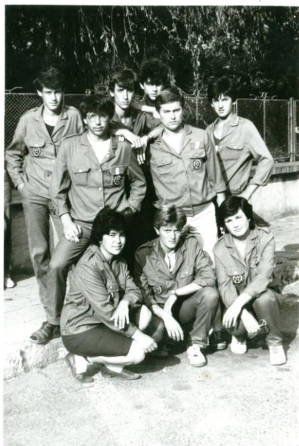
Бригадири 1987 год.

През месец октомври 1988 г. се провеждат ежегодните средношколски бригади. Учениците от IX класове са на бригада в с. Тракия, Хасковско. Трудовите резултати приключват при 100% изпълнение. Учениците са разквартирувани по къщите, което предполага по-слаб контрол от страна на учителите. В резултат на това за системни нарушения: неявяване на работа, неспазване на вечерния час и други, от бригадата са освободени три ученички от IXб клас. На педагогически съвет едната от тях е изключена, а на другите две е намалено поведението.