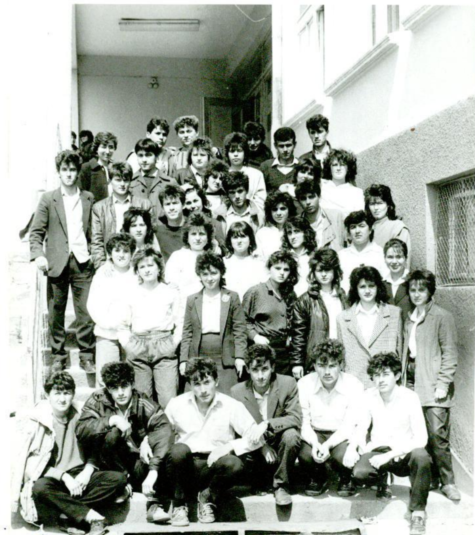
Выпуск 1988 година