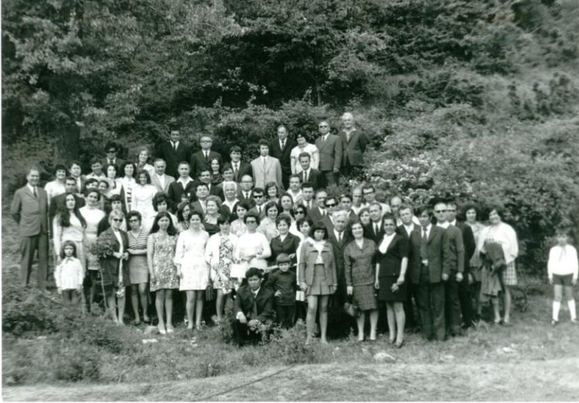
Честване на 10 години от създаването на гимназия в с. Черноочене – 1973 година