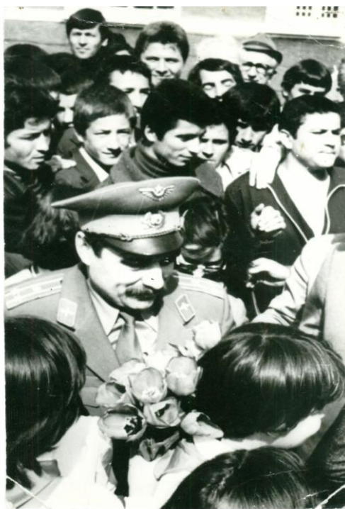
Първият български космонавт Георги Иванов в Черноочене

На 10 април 1979 г. в космоса полита първият български космонавт – Георги Иванов. Той заедно с Николай Рукавишников (командира на космическия полет) са посрещнати като истински герои при пристигането им в с. Черноочене две години след полета им – на 14 април 1981 г. Учениците им подаряват много лалета и други пролетни цветя. Правят се снимки и се дават много автографи.