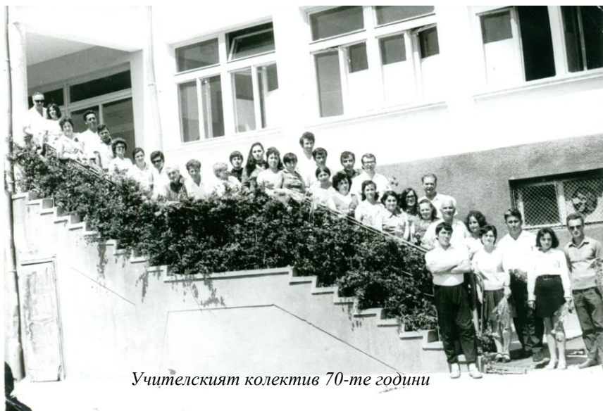
Учителският колектив 70-те години